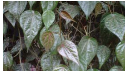
Gambar 1. Daun sirih merah

Pada penelitian ini, di gunakan sampel daun sirih merah yang telah dibuktikan kebenaran identitasnya. Determinasi dilakukan di Materia Medika Batu Malang. Kebenaran identitas sampel dibuktikan dengan hasil determinasi yang menyatakan bahwa sampel yang digunakan merupakan daun sirih merah