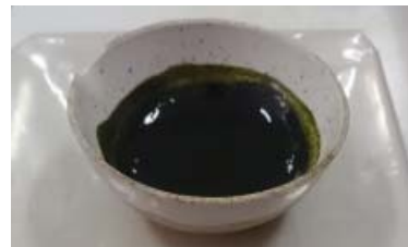
Gambar 2. Hasil ekstraksi daun sirih merah