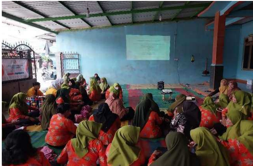
Gambar 1. Pemberian Materi Edukasi Berbasis Masyarakat (E-DIMAS)