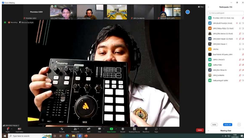
Gambar 2. Pelatihan Produksi Podcast